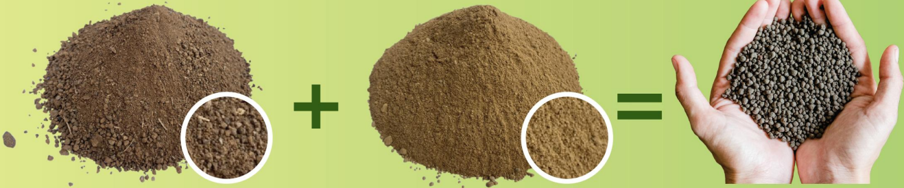
ส่วนผสมหลัก Filter Cake (ฟิเตอร์เค้ก)